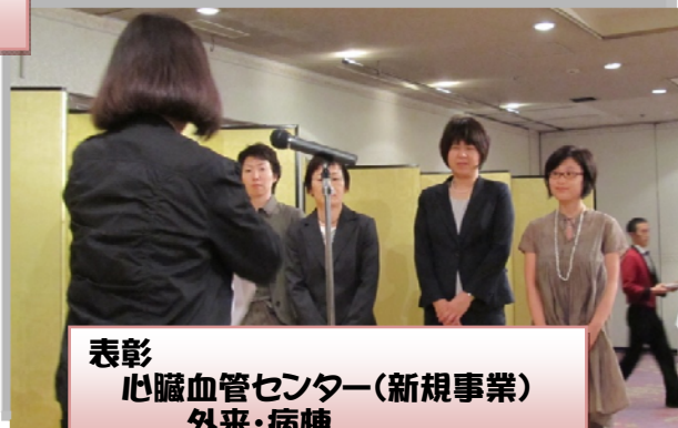
表彰 心臓血管センター(新規事業) 外来・病棟