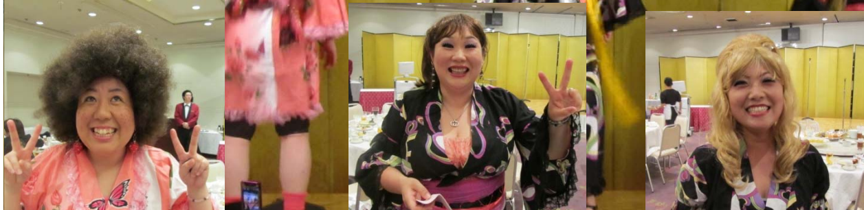
今年のメインイベント “新川橋美容室” サイコーに会場を盛り上げ てくれました。思わず来賓も 踊り出す騒動に!!!