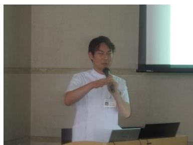
吉原医師 減量で糖尿病以外の病気も改善