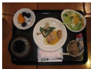
500kcalの食事 低カロリーでも大満足