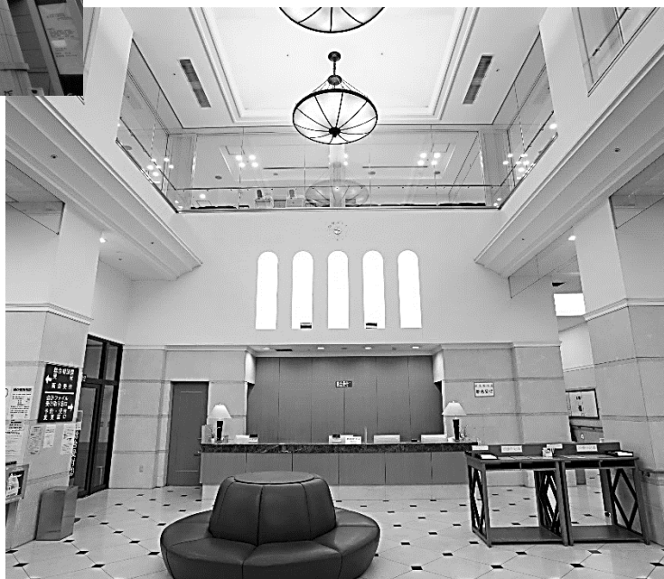
医療法人明徳会（財団）総合新川橋病院